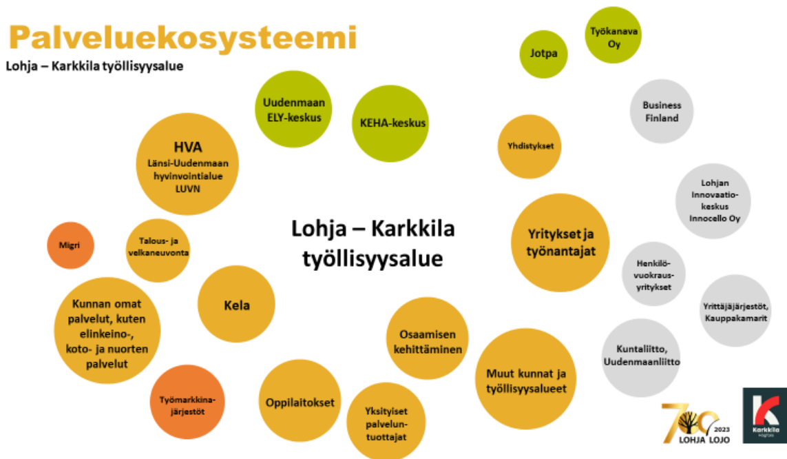
Kuva 3. Lohja-Karkkilan työllisyysalueen palveluekosysteemi

Lohja-Karkkila työllisyysalueen palveluiden kehittäminen toteutetaan parviällyn keinoin. Palveluita kehitetään vuoden 2024 aikana ja työryhmiin tullaan kutsumaan kunnan työllisyydestä ja yrityspalveluista vastaavien virkahenkilöiden kanssa niin työllisyyden asiantuntijoita, yrittäjiä, oppilaitosten edustajia, yhdistysten jäseniä kuin yksittäisiä kuntalaisia, jotka ovat itse työnhakija-asiakkaana sekä TE-asiantuntijoita mahdollisuuksien mukaan.