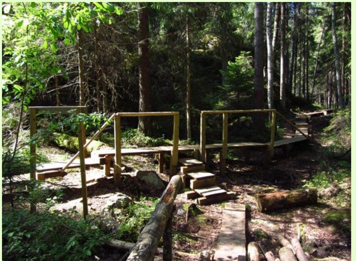
Pitkospuita korjataan ja rakennetaan tarvittaessa ja polku pidetään kävelykunnossa myös talvella.