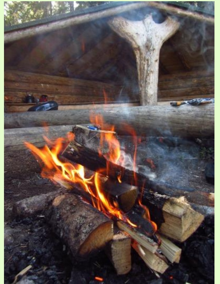
Ahvenalammen laavupaikka. Karnaistenkorvesta löydät kaksi laavua nuotiopaikkoineen ja polttopuineen.