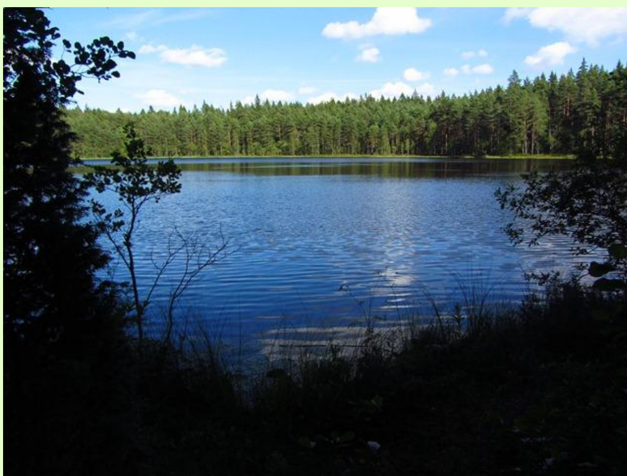
Tule nauttimaan Karnaistenkorven rauhallisesta metsäalueesta ja kauniista maisemista.