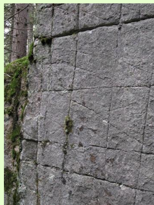
Luontopolun rasteilla kerrotaan Karnaistenkorven luonnosta – kasveista, eläimistä ja luonnonilmiöistä.